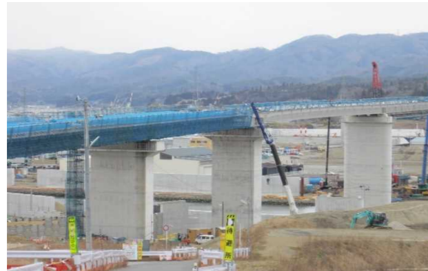
▲No.90付近から終点側を望む [(仮)気仙沼湾横断橋 P4～P12]