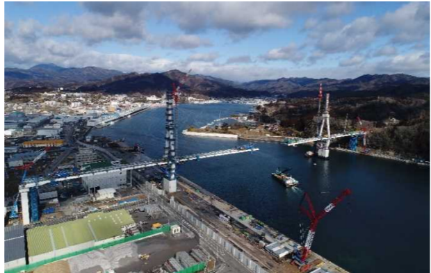
▲No.150付近から終点側を望む [(仮)気仙沼湾横断橋 P11～P12]

朝日地区舗装工事 受注者: 戸田道路(株) 工期: R2.2.4～R3.2.10