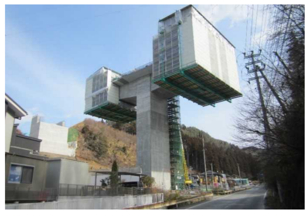
▲No271から終点側を望む [鹿折橋(仮)]

① No.150 国道45号気仙沼地区道路工事 受注者: 三井住友建設(株) 工期: H30.3.14～R2.3.13 橋梁