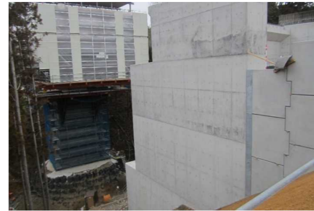
▲No285から終点側を望む [大峠山橋(仮)]

② No.285 国道45号大峠山地区道路工事 受注者: 戸田建設(株) 工期: H30.3.8～R2.6.30 橋梁