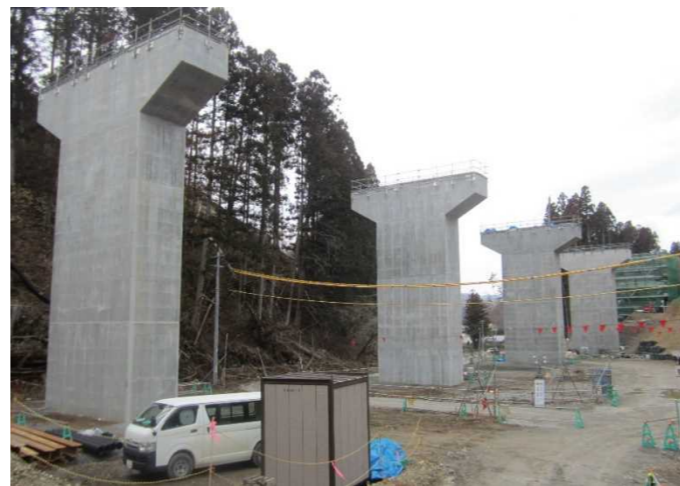
▲No.228から終点側を望む [浪板大橋(仮)]