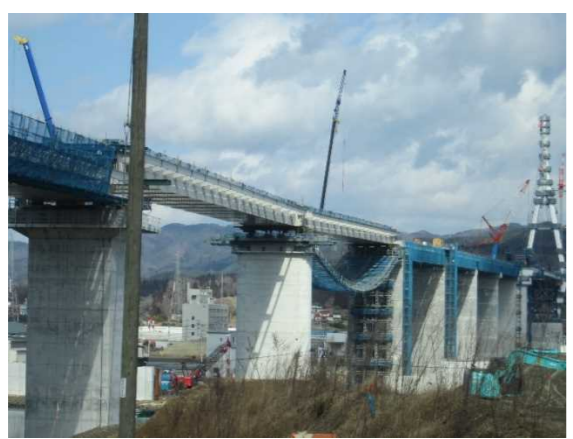
▲No.90付近から終点側を望む 〔(仮)気仙沼湾横断橋 P4～P12〕