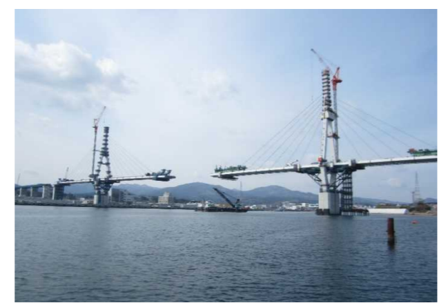
▲No.150付近から起点側を望む 〔(仮)気仙沼湾横断橋 P11～P12〕