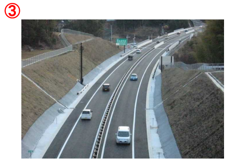
▲第2号跨道橋から本線を望む