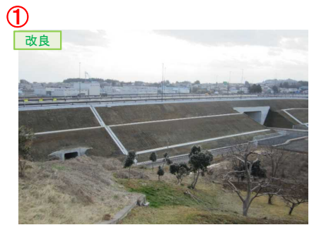
▲No.16北側から本線を望む [左：第4号道路函渠] [右：第3号道路函渠]

松崎北沢地区舗装工事 受注者：大成ロテック(株) 工期：H31.2.15～R2.2.21