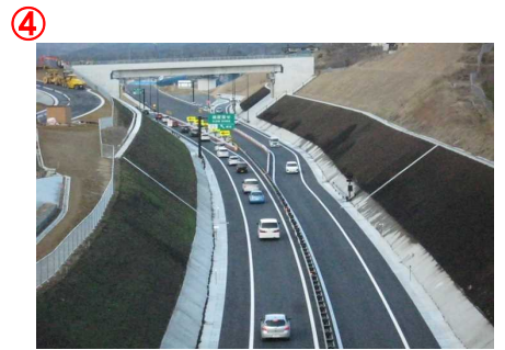
▲第2号跨道橋から本線を望む