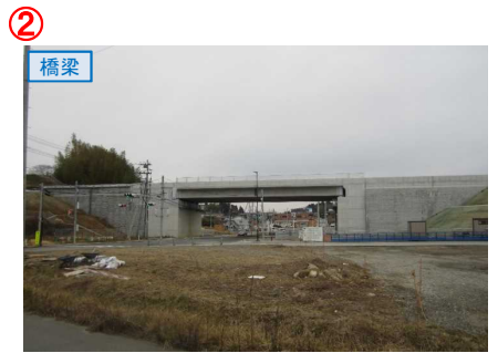
▲No.27南側から本線を望む [片浜1号橋]