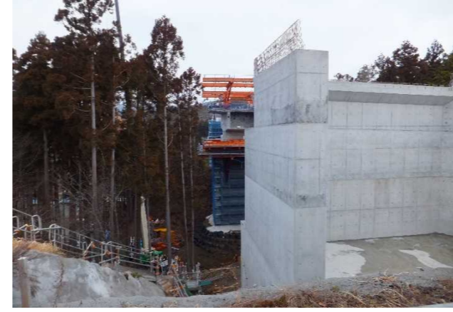
▲No285から終点側を望む [大峠山橋(仮)]