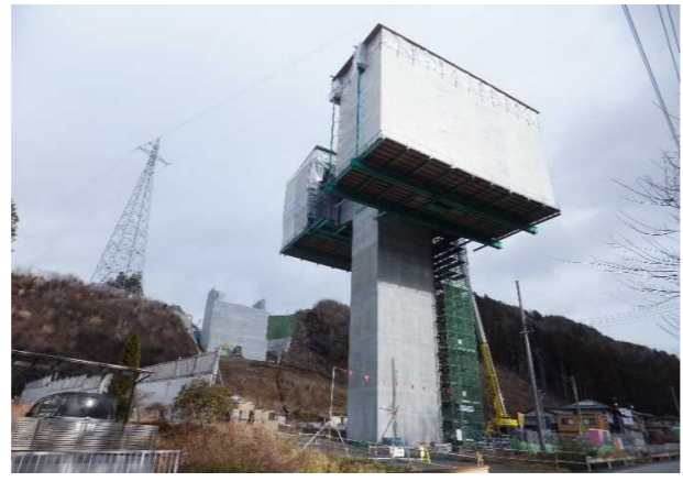
▲No271から終点側を望む [鹿折橋(仮)]