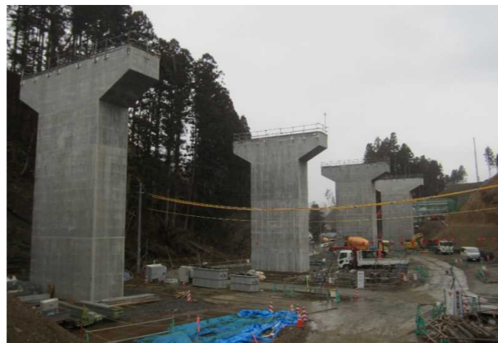
▲No.228から終点側を望む [浪板大橋(仮)]