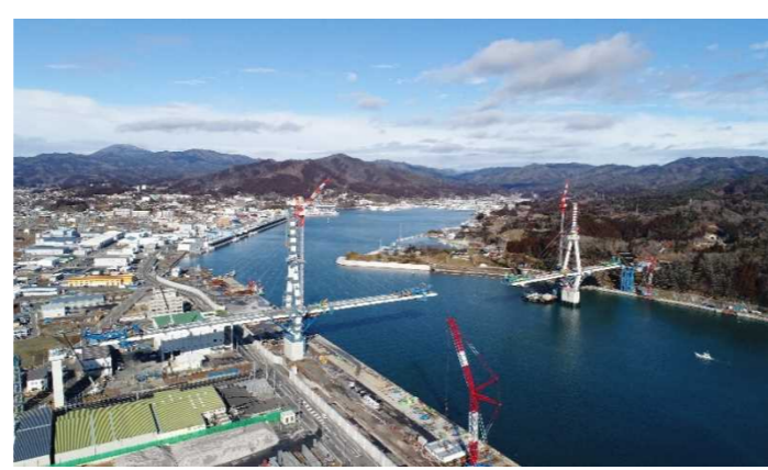
▲No.122付近から終点側を望む 〔(仮)気仙沼湾横断橋 P11～A2〕