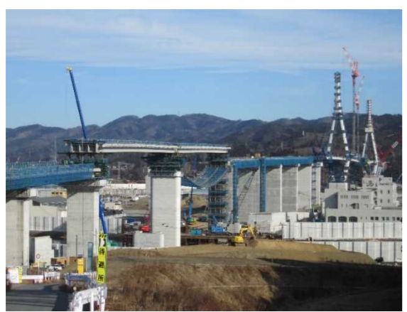
▲No.90付近から終点側を望む 〔(仮)気仙沼湾横断橋 P4～P12〕