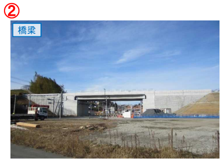
▲No.27南側から本線を望む [片浜跨道橋(仮)]