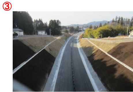
▲第2号跨道橋から本線を望む