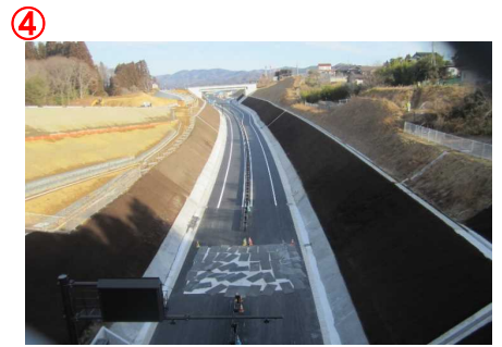
▲第2号跨道橋から本線を望む