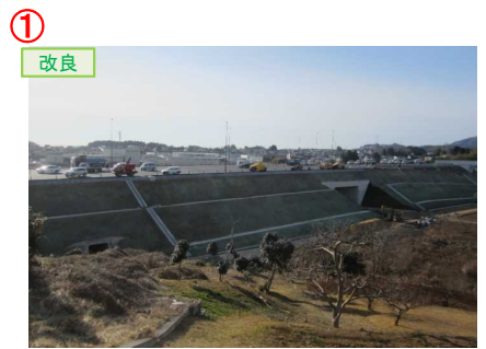
▲No.16北側から本線を望む [左: 第4号道路函渠] [右: 第3号道路函渠]

松崎北沢地区舗装工事 受注者: 大成ロテック(株) 工期: H31.2.15～R2.2.21