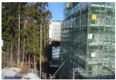
▲No285から終点側を望む [大峠山橋(仮)]