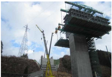
▲No271から終点側を望む [鹿折橋(仮)]