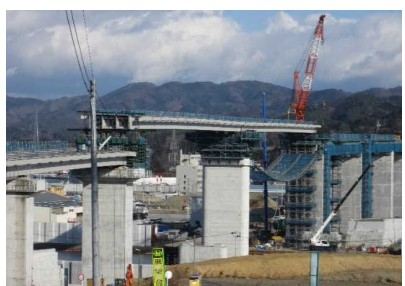
▲No.90付近から終点側を望む [(仮)気仙沼湾横断橋 P4～P12]