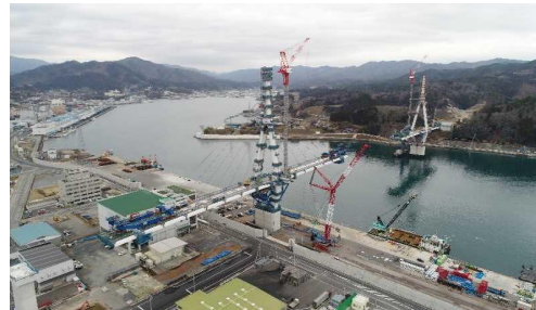
▲No.122付近から終点側を望む [(仮)気仙沼湾横断橋 P11～A2]