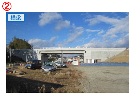
▲No.27南側から本線を望む [片浜跨道橋(仮)]