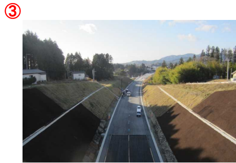
▲第2号跨道橋から本線を望む