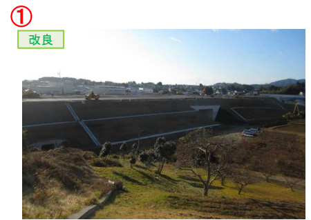
▲No.16北側から本線を望む [左: 第4号道路函渠] [右: 第3号道路函渠]

松崎北沢地区舗装工事 受注者: 大成ロテック(株) 工期: H31.2.15～R2.2.28