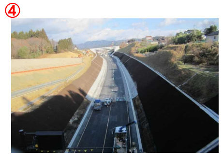
▲第2号跨道橋から本線を望む