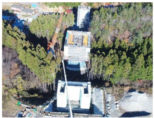
▲No285から終点側を望む [大峠山橋(仮)]