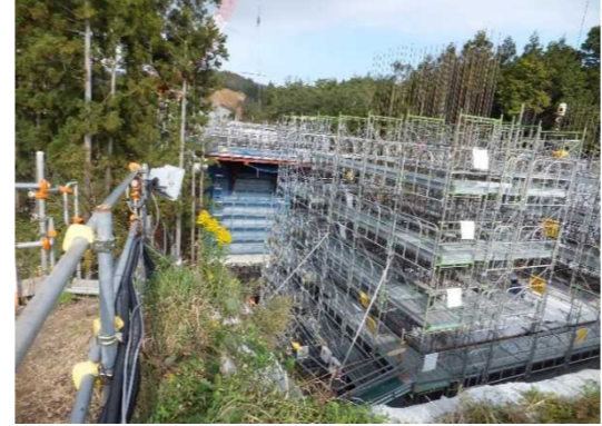
▲No285から終点側を望む [大峠山橋(仮)]