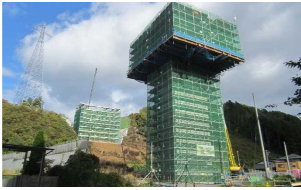
▲No271から終点側を望む [鹿折橋(仮)]