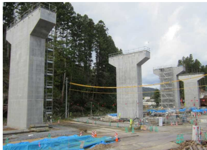
▲No.228から終点側を望む [浪板大橋(仮)]