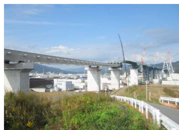
▲No.90付近から終点側を望む 〔(仮)気仙沼湾横断橋 P4～P12〕