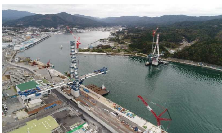
▲No.122付近から終点側を望む 〔(仮)気仙沼湾横断橋 P11～A2〕