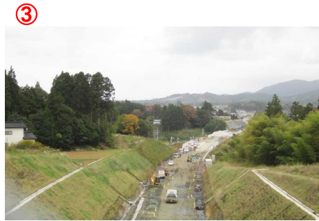
▲第2号跨道橋から本線を望む