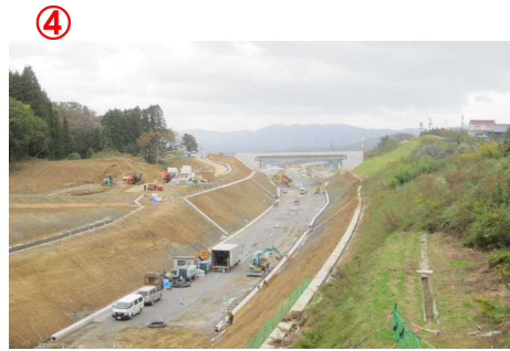
▲第2号跨道橋から本線を望む