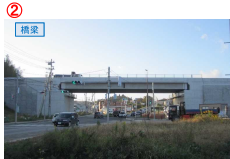
▲No.27南側から本線を望む [片浜跨道橋(仮)]