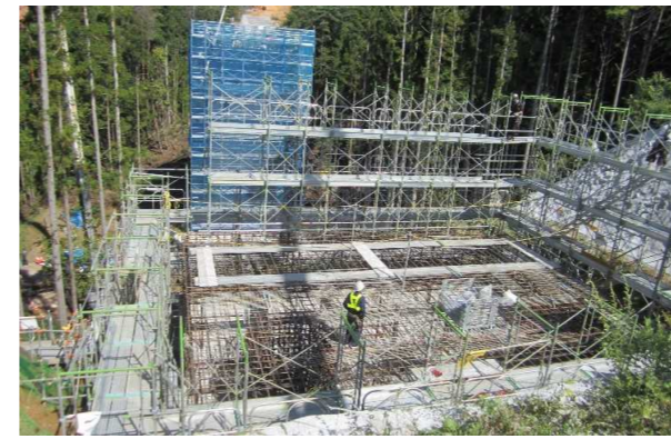
▲No285から終点側を望む [大峠山橋(仮)]