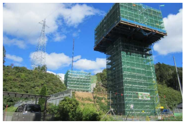
▲No271から終点側を望む [鹿折橋(仮)]