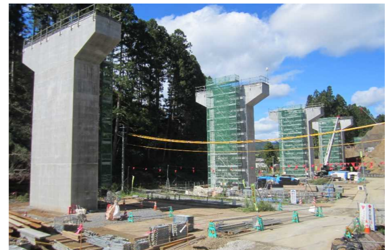
▲No.228から終点側を望む [浪板大橋(仮)]