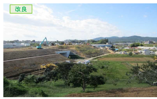
▲No.16北側から本線を望む [左: 第4号道路函渠] [右: 第3号道路函渠]