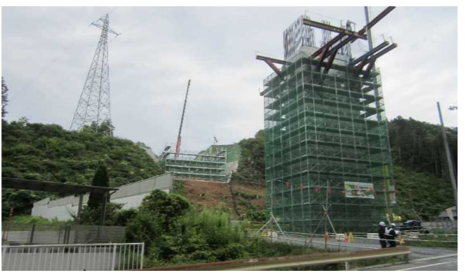
▲No271から終点側を望む [鹿折橋(仮)]

① 国道45号気仙沼地区道路工事 受注者:三井住友建設(株) 工期:H30.3.14~H32.3.13 No.150 橋梁