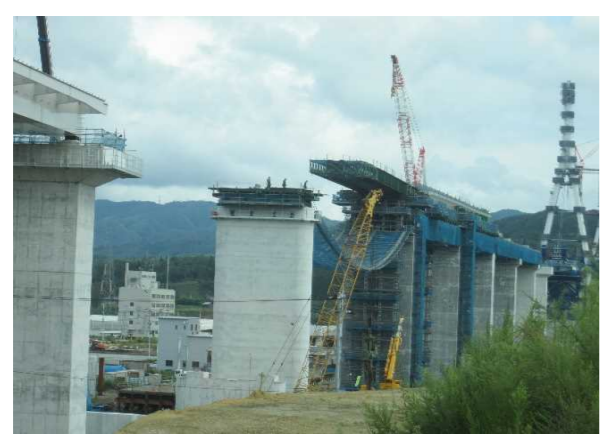
▲No.90付近から終点側を望む 〔(仮)気仙沼湾横断橋 P4～P12〕