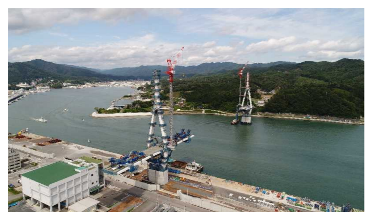
▲No.122付近から終点側を望む 〔(仮)気仙沼湾横断橋 P11～A2〕