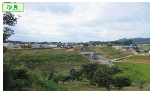
▲No.16北側から本線を望む [左:第4号道路函渠] [右:第3号道路函渠]