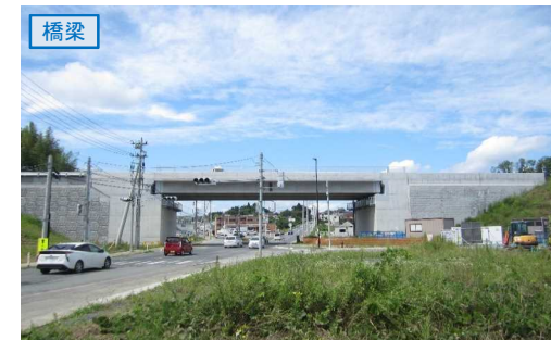
▲No.27南側から本線を望む [片浜跨道橋(仮)]