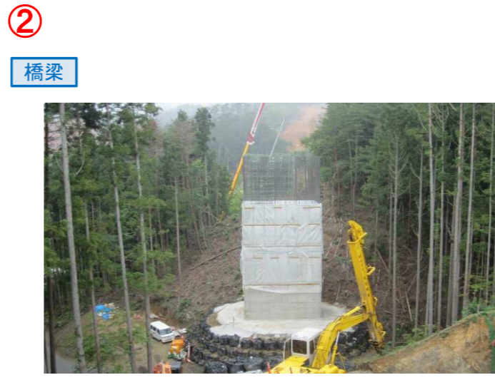
▲No285から終点側を望む [大峠山橋(仮)]