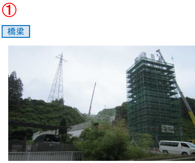
▲No271から終点側を望む [鹿折橋(仮)]