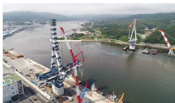
▲No.122付近から終点側を望む [(仮)気仙沼湾横断橋 P11～A2]