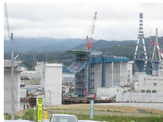
▲No.90付近から終点側を望む [(仮)気仙沼湾横断橋 P4～P12]