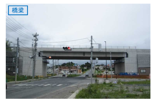
▲No.27南側から本線を望む [片浜跨道橋(仮)]