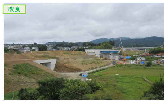
▲No.16北側から本線を望む [左: 第4号道路函渠] [右: 第3号道路函渠]