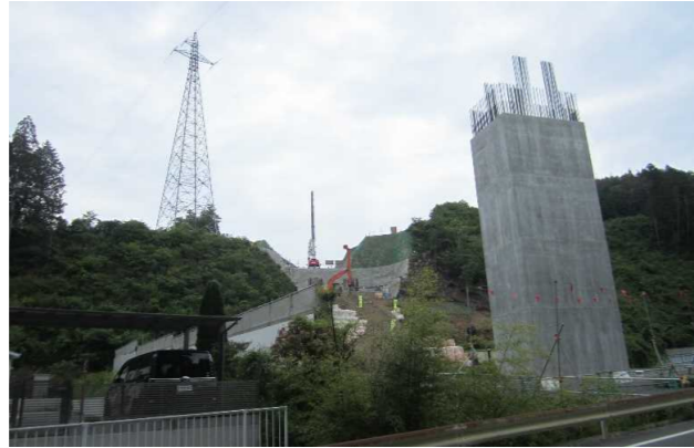
▲No271から終点側を望む [鹿折橋(仮)]