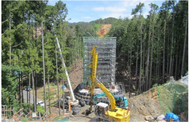
▲No285から終点側を望む [大峠山橋(仮)]