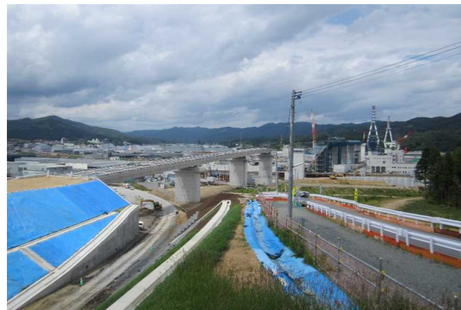
▲No.80東側から終点側を望む [(仮)気仙沼湾横断橋]