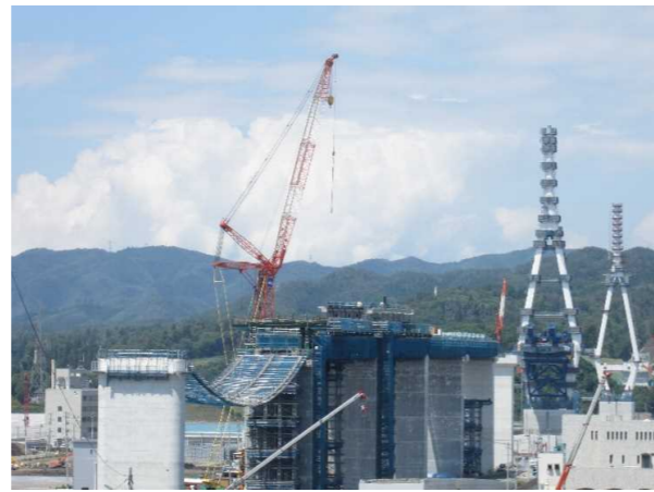
▲No.90付近から終点側を望む [(仮)気仙沼湾横断橋 P4～P12]