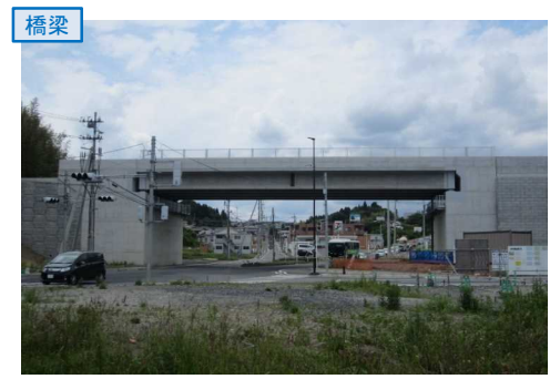
▲No.27南側から本線を望む [片浜跨道橋(仮)]