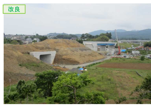
▲No.16北側から本線を望む [左: 第4号道路函渠] [右: 第3号道路函渠]