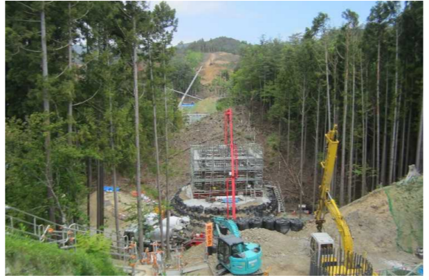
▲No285から終点側を望む [大峠山橋(仮)]