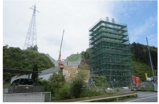
▲No271から終点側を望む [鹿折橋(仮)]