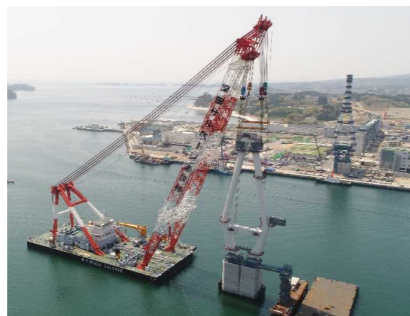
▲No.148から起点側を望む 〔(仮)気仙沼湾横断橋 P12主塔架設〕