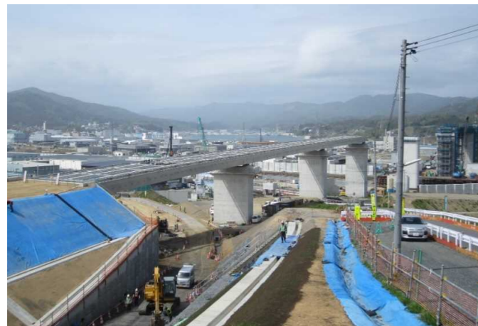
▲No.80東側から終点側を望む 〔(仮)気仙沼湾横断橋〕