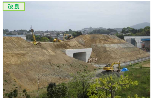
▲No.16北側から本線を望む [左: 第4号道路函渠] [右: 第3号道路函渠]