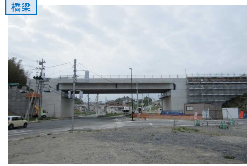
▲No.27南側から本線を望む [片浜跨道橋(仮)]