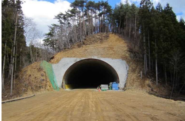
▲No350から起点側を望む [気仙沼第2号トンネル(仮)]