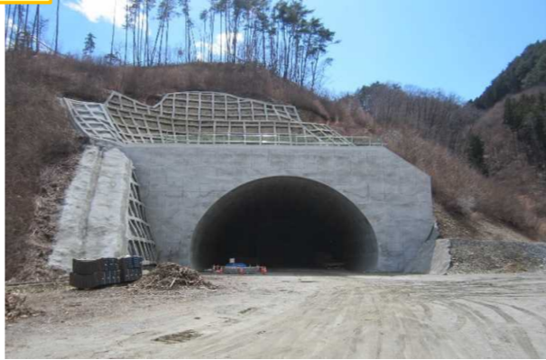
▲No410から終点側を望む [気仙沼第2号トンネル(仮)]