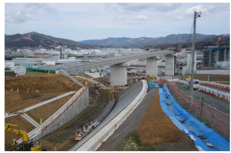
▲No.80東側から終点側を望む 〔(仮)気仙沼湾横断橋〕