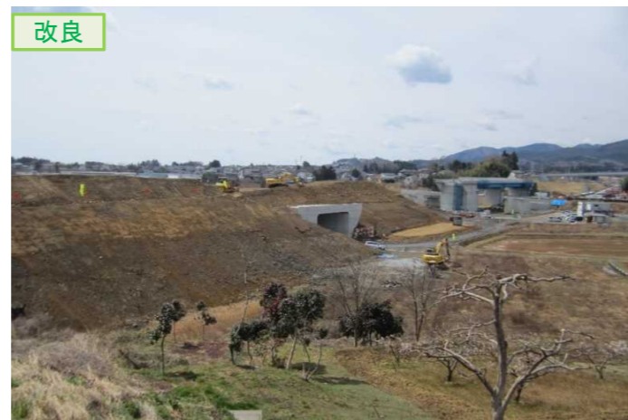
▲No.16北側から本線を望む [左: 第4号道路函渠] [右: 第3号道路函渠]