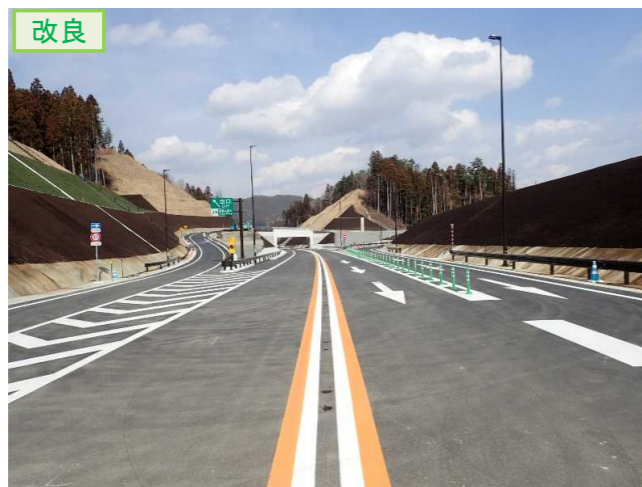
▲No.20から終点側を望む [唐桑小原木IC]