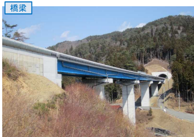
▲No.80東側から終点側を望む [青野沢川橋]