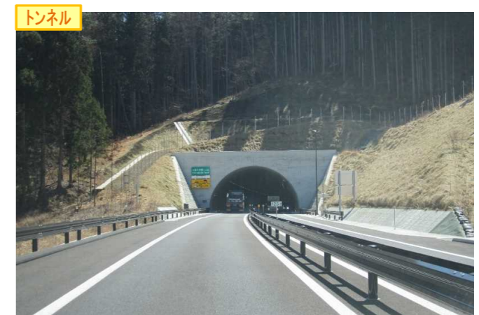
▲No.148から起点側を望む [小原木長部トンネル]