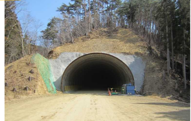
▲No350から起点側を望む [気仙沼第2号トンネル(仮)]