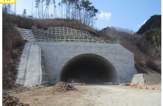
▲No410から終点側を望む [気仙沼第2号トンネル(仮)]