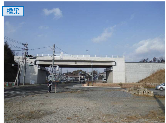
▲No.27南側から本線を望む [片浜跨道橋(仮)]