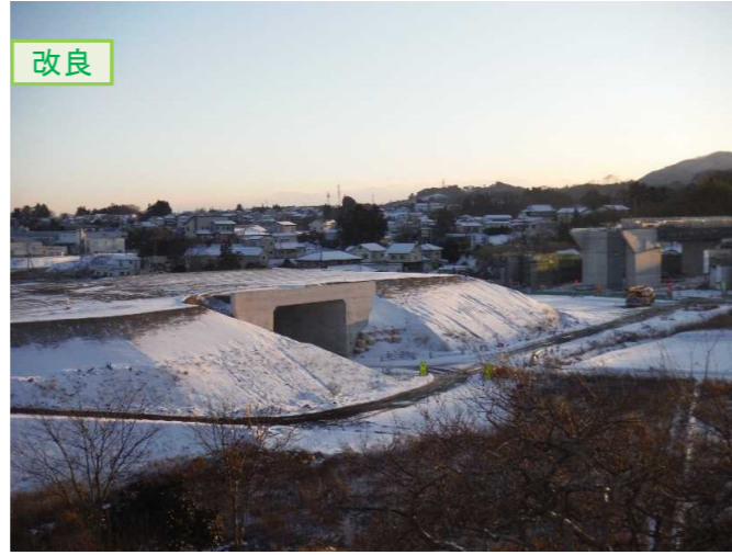
▲No.16北側から本線を望む [左: 第4号道路函渠] [右: 第3号道路函渠]