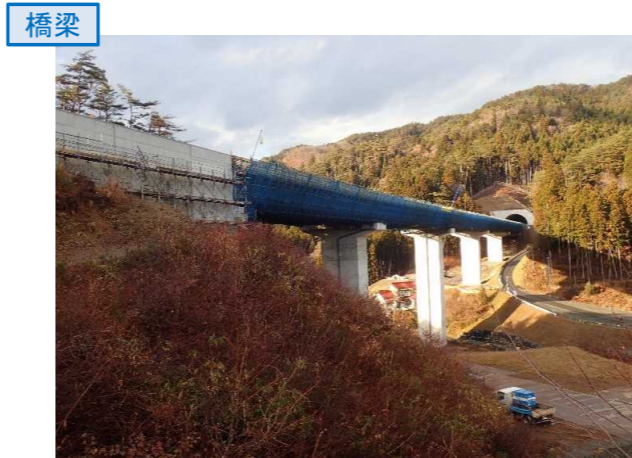
▲No.80東側から終点側を望む [青野沢川橋(仮)]