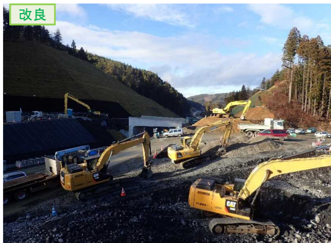
▲No.20から終点側を望む [唐桑北IC(仮)]