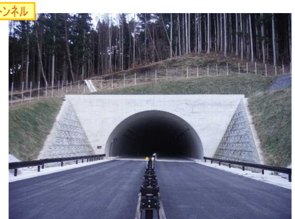
▲No.148から起点側を望む [県境トンネル(仮)]