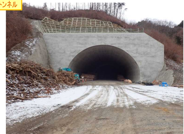
▲No410から起点側を望む [気仙沼第2号トンネル(仮)]