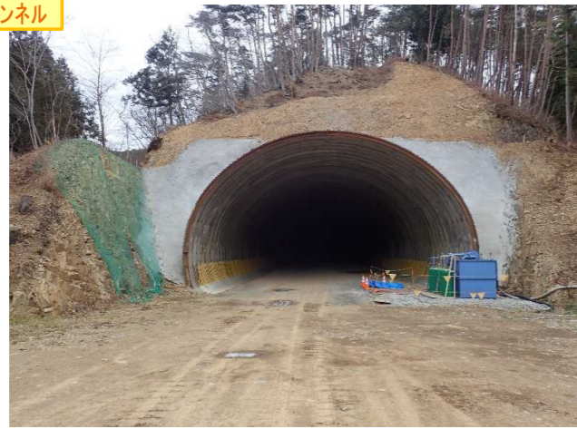
▲No350から終点側を望む [気仙沼第2号トンネル(仮)]