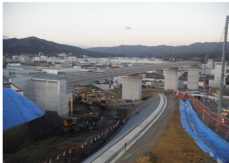
▲No.80東側から終点側を望む 〔(仮)気仙沼湾横断橋〕