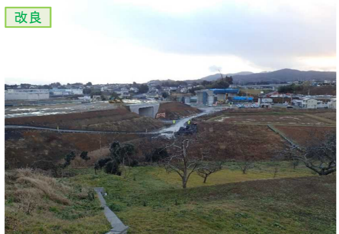
▲No.16北側から本線を望む [左: 第4号道路函渠] [右: 第3号道路函渠]