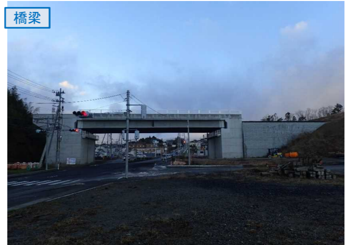
▲No.27南側から本線を望む [片浜跨道橋(仮)]