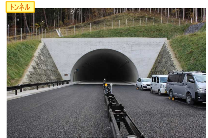
▲No.148から起点側を望む [県境トンネル(仮)]