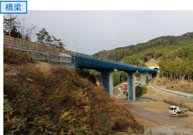
▲No.80東側から終点側を望む [青野沢川橋(仮)]