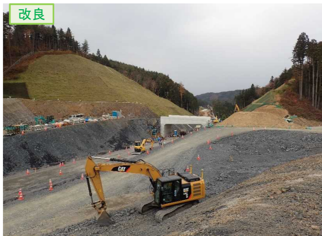
▲No.20から終点側を望む [唐桑北IC(仮)]