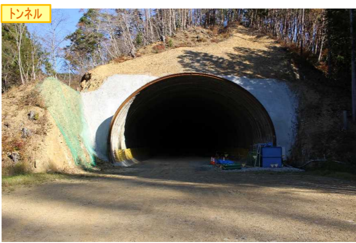
▲No350から終点側を望む [気仙沼第2号トンネル(仮)]