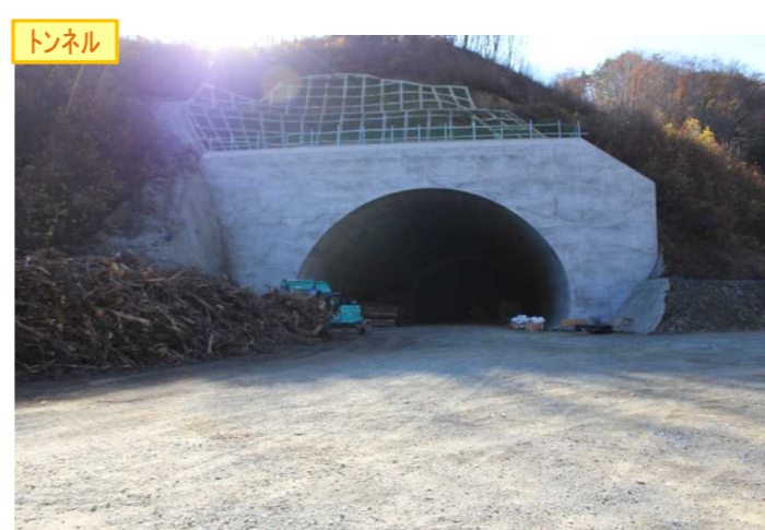
▲No410から起点側を望む [気仙沼第2号トンネル(仮)]