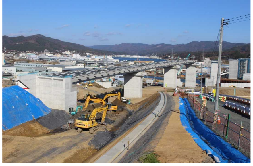
▲No.80東側から終点側を望む 〔(仮)気仙沼湾横断橋〕