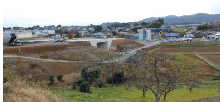
▲No.16北側から本線を望む [左: 第4号道路函渠] [右: 第3号道路函渠]