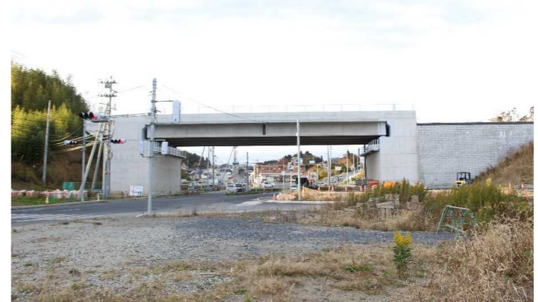
▲No.27南側から本線を望む [片浜跨道橋(仮)]