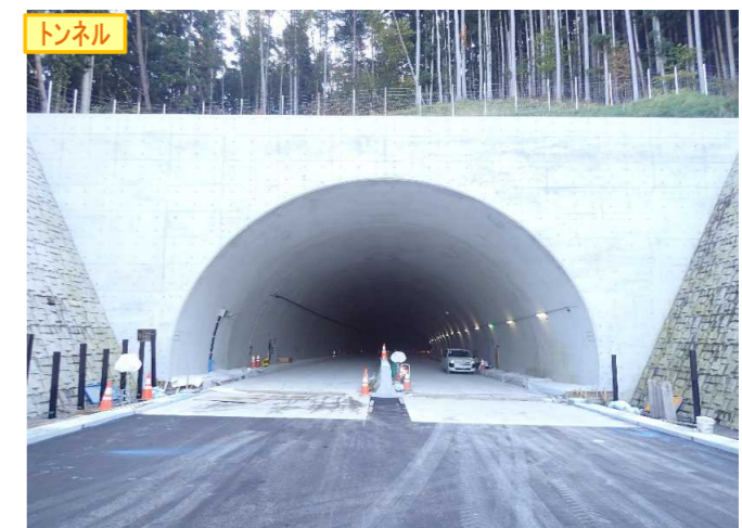
▲No.148から起点側を望む [県境トンネル(仮)]