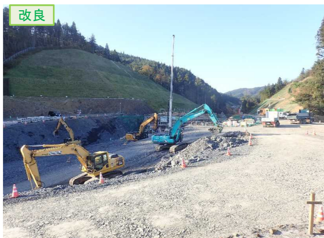
▲No.20から終点側を望む [唐桑北IC(仮)]