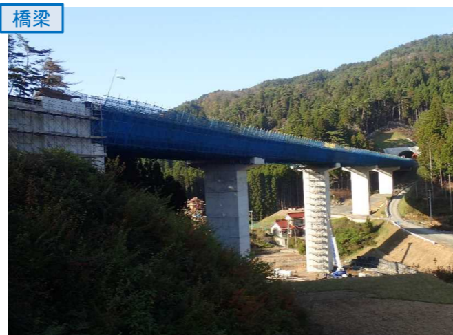
▲No.80東側から終点側を望む [青野沢川橋(仮)]