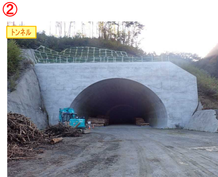
▲No410から起点側を望む [気仙沼第2号トンネル(仮)]