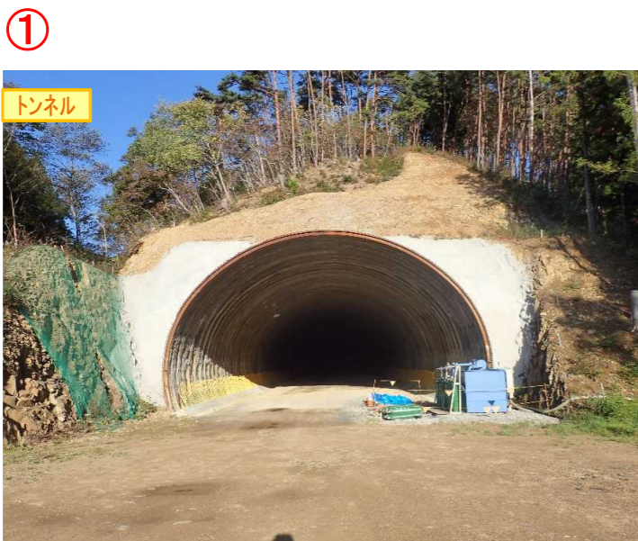
▲No350から終点側を望む [気仙沼第2号トンネル(仮)]

国道45号大峠山地区道路工事 受注者: 戸田建設(株) 工期: H30.3.8～H32.6.30