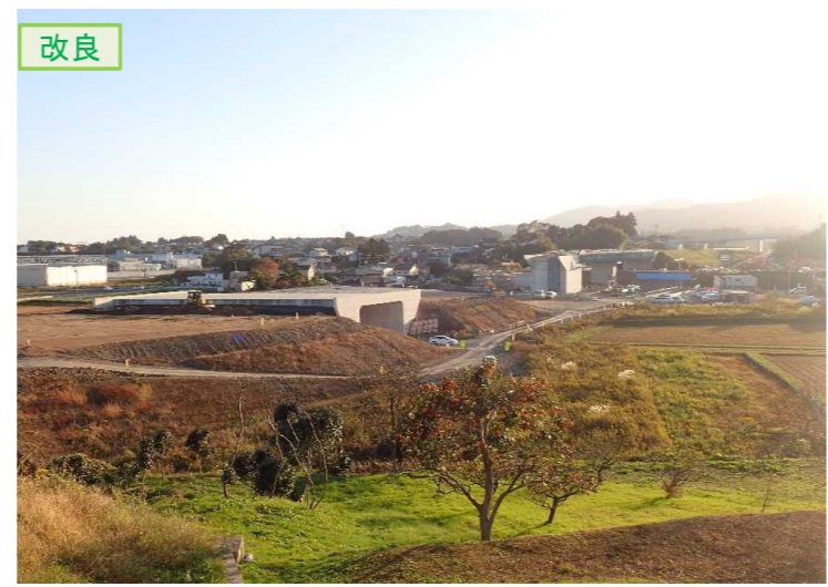
▲No.16北側から本線を望む [左: 第4号道路函渠] [右: 第3号道路函渠]