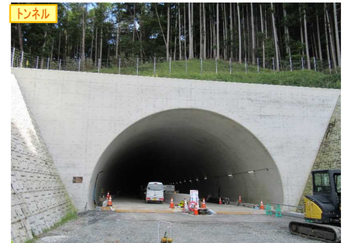
▲No.148から起点側を望む [県境トンネル(仮)]