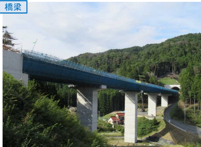
▲No.80東側から終点側を望む [青野沢川橋(仮)]