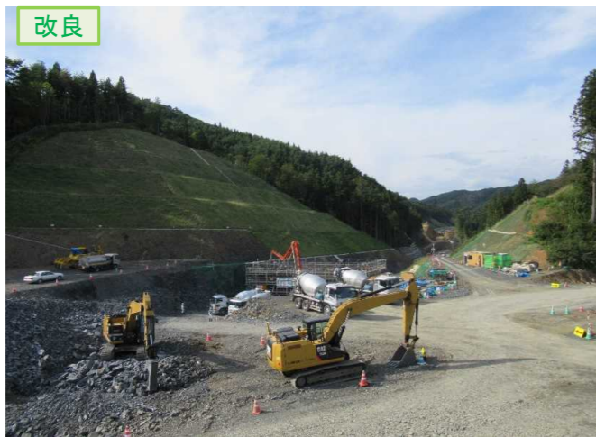
▲No.20から終点側を望む [唐桑北IC(仮)]